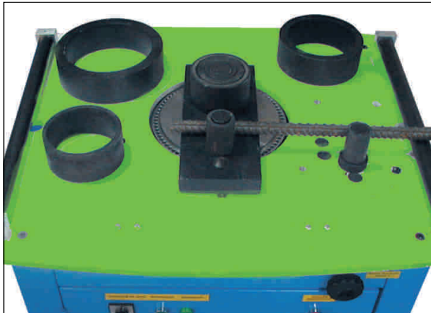
Kit Especial de doblado (UNE 36831). Opcional.